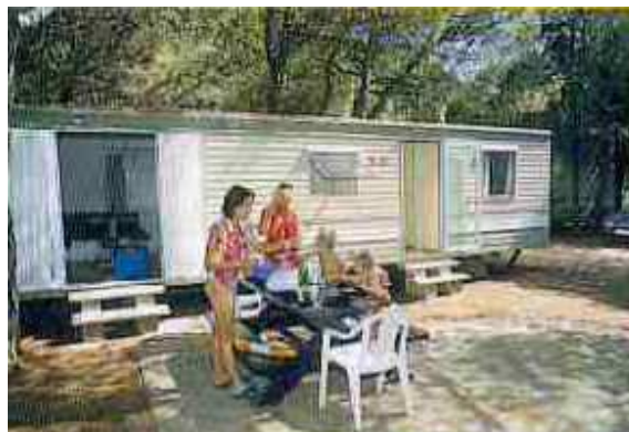
Les lieux d'hébergement