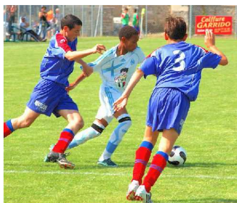
Les jeunes joueurs en action !